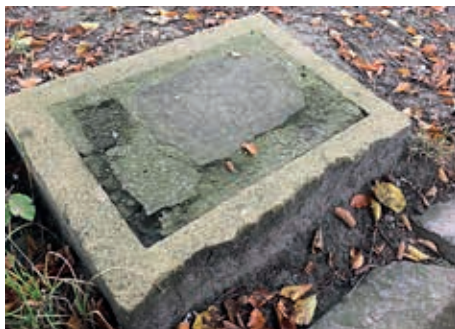
Steinplatte unter der Buche am „Waitzplatz“

Wir, der BVFO und die IG Waitzstraße, möchten also diese Steinplatte sanieren und gravieren lassen, suchen dazu auch noch einen Sponsor, der natürlich dann mit eingraviert wird! Die Kosten kläre ich gerade mit einem Steinmetz. Wer Interesse hat, möge sich sehr gern bei mir melden.