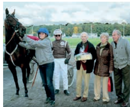
Neben dem Siegerpferd „Litana“ mit der Pferdepflegerin von links:

Preis des Bürgervereins Flottbek-Othmarschen: